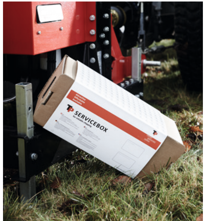
TP SERVICE BOX

TP Flismaskiner är byggda för att klara tuffa förhållanden, men slitdelar varar naturligtvis inte för evigt. Vi rekommenderar alltid att du använder originalslitage och reservdelar och att du byter ut slitdelar i tid. Detta kommer att resultera i både bättre spänkvalitet och bränsleekonomi. Samtidigt hjälper du till att optimera driftsäkerheten och förlänga flishuggens livslängd. Vi levererar fortfarande slitdelar till TP flishuggare med mer än 20 års erfarenhet!