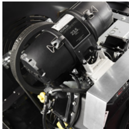
Kohler Pro / HONDA bensinmotor