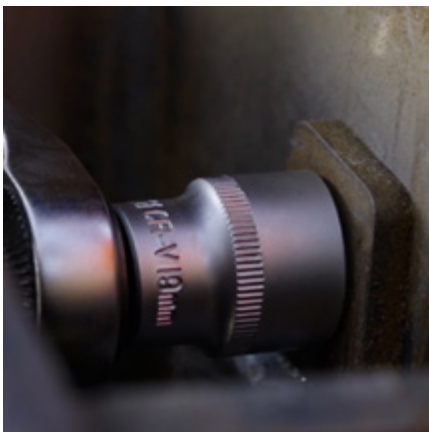
Enkel och enkel service