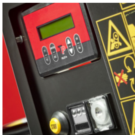
TP PILOT+ med TP STARTER. Till- och frånkoppling av remmar.

Den uppgraderade TP PILOT+ (varvtalsvakt) och TP EASY CONTROL med reversering, återställning och inmatningsfunktion gör din arbetsdag ännu mer effektiv. TP VARIO SPOUT är ett utkastarrör som är manuellt justerbart i höjddled, med fem utkastarpositioner. Det ger flexibilitet under arbete, transport och förvaring.