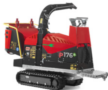
Manuell manövrering och plattform med 20 kg säkerhetsbrytare

Litiumbatteriet på 325 ampere säkerställer upp till 5 timmars drift med blandat material. Strömförsörjning: 230 Volt.