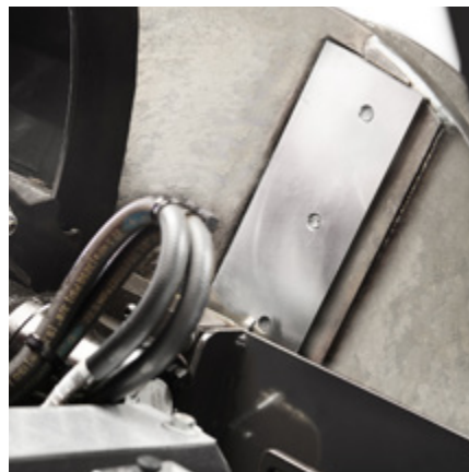
Två förskjutna knivar är konstant i kontakt med materialet