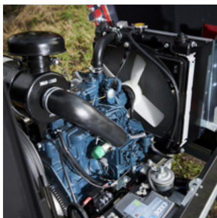
Högt vridmoment 3 eller 4 cyl. Kubota