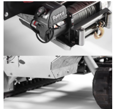
TP Vinsch kan användas när flishuggen ska upp eller ner för backar. Marknadens största frihöjd: 200 mm Variabel larvbandsbredd: 1 150–1 300 mm Förstärkt skydd av hydraulikslangar.