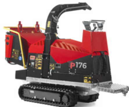
Manuell manövrering och plattform med säkerhetsbrytare