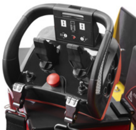
Säkerhet och komfort med fjärrkontroll