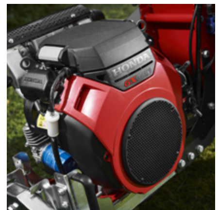
2-cylindrig luftkyld HONDA bensinmotor med elstart eller B&S Vanguard motor