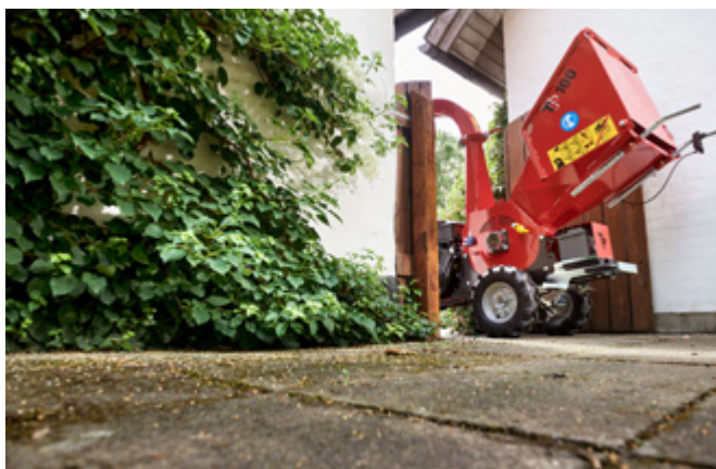
Bredd: 74 cm Vikt: 314 kg