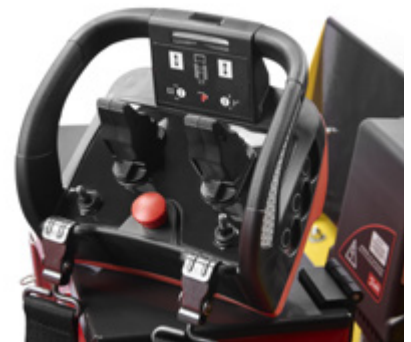
Komfort med fjärrkontroll