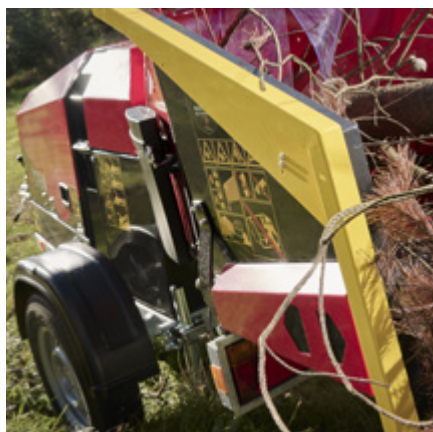
TP Easy Control. Återställning – Reversering – Inmatning