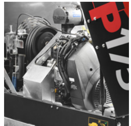
Stark Kohler EFI-motor med 38 hk