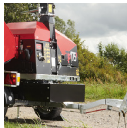
220° svängning är tillval (ökar vikt 80 kg)