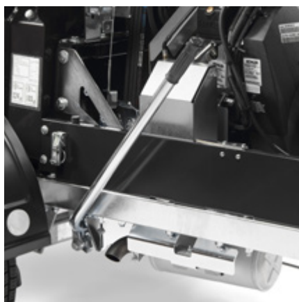
Mekanisk koppling och gasreglage