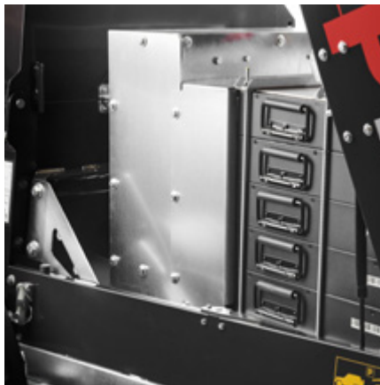
20 kWh (5 timmar). Litiumbatterier (LiNiMnCoO 2 65V) ger upp till 5 timmars drift